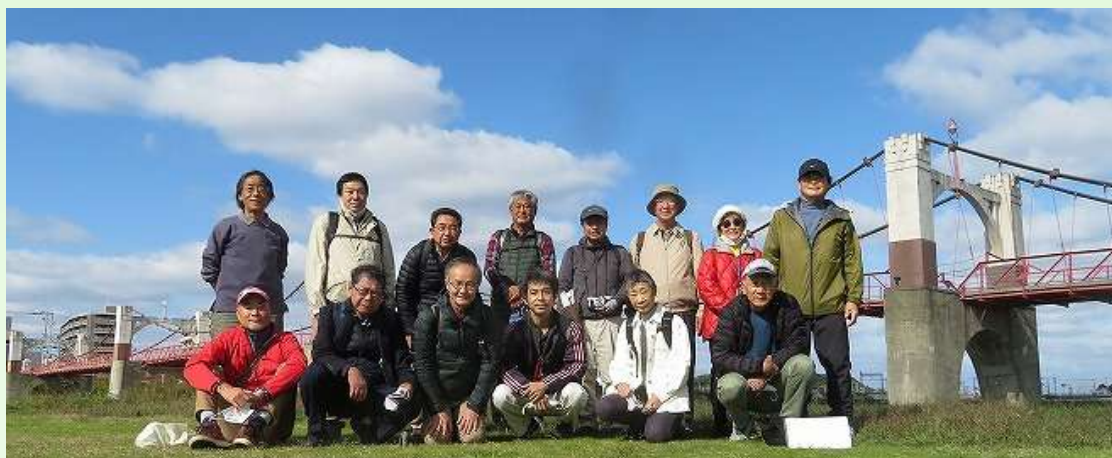
土木遺産見学会「玉手橋」にて（2020 年 11 月）