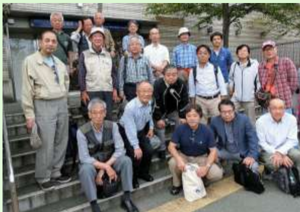
淀川沿いの橋の現地調査（2017 年 9 月）