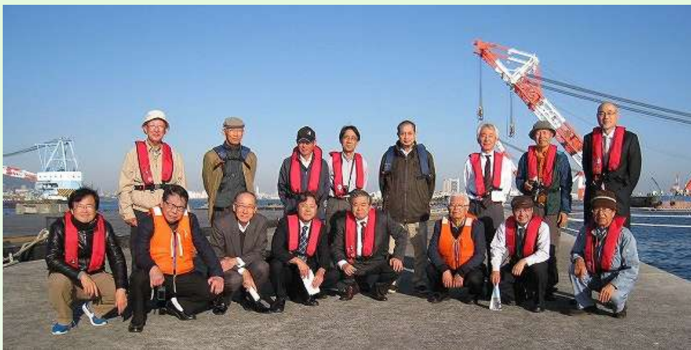
大阪湾岸道路西伸部ルート海上見学会「第 5 防波堤上」にて (2017 年 11 月)

今回、CVV 活動の一つである技術伝承の一環として、現在のメンバーに呼びかけ、各人の経験談などを取りまとめ「CVV な男たち・女たち」としてまとめることとなった。このパンフレットは各人の原稿タイトルと概要を掲載したもので、2.コンテンツの概要文章右の QR コードにアクセスすれば、本文を読むことが出来る。なお、旧メンバーによる「CVV な男たち・女たち」も CVV のホームページに掲載されているので、興味のある方は 3.あとがき末尾の QR コードにアクセスして参照頂ければ幸いである。