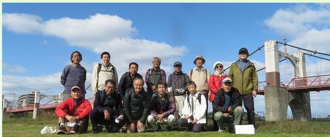
土木遺産見学会「玉手橋」にて（2020年11月）