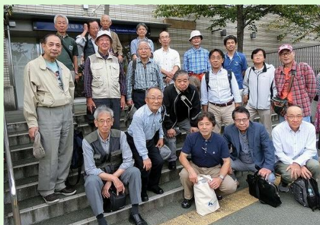
淀川沿いの橋の現地調査（2017年9月）