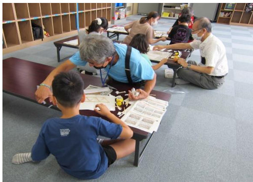
手解きを受けながら模型づくりに取り組む児童達