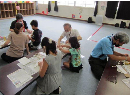
一生懸命に模型づくりに取り組む児童達