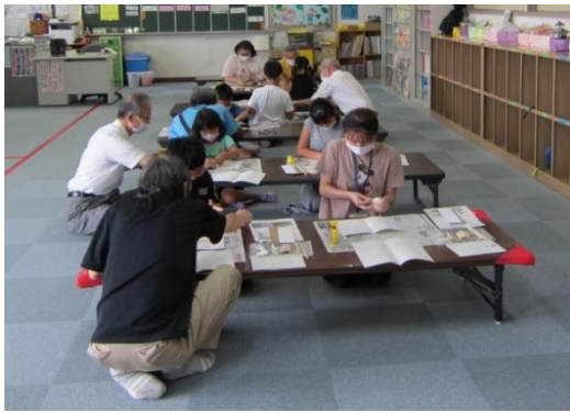
橋の模型づくりに取り組む児童達と支援者達