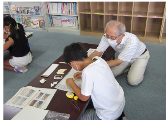
トラス橋の模型づくりに取り組む児童