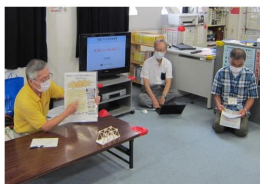
今日の活動内容を紹介する CVV メンバー