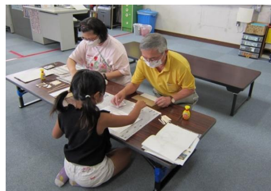
手解きを受けながら模型づくりに取り組む児童