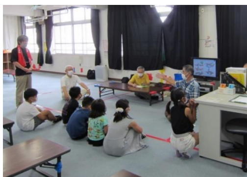
北津守小いきいき活動桑村先生開催挨拶