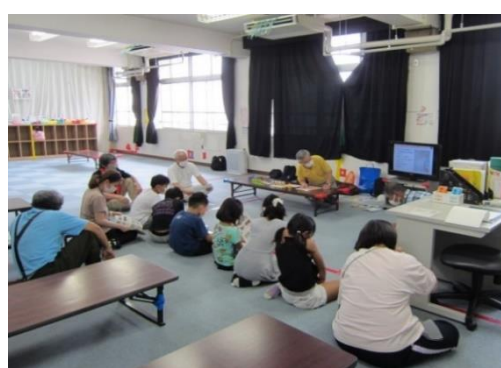
橋の模型づくりの説明に聞き入る児童達