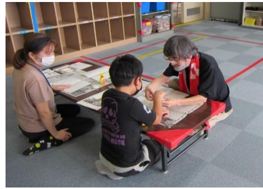
模型づくりに取り組む児童と支援者の手解き