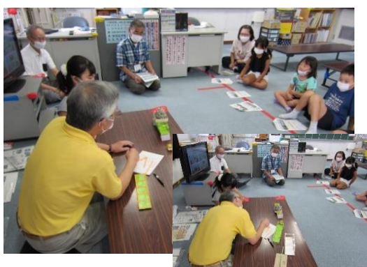
けた橋とトラス橋の載荷実験を体験する児童達