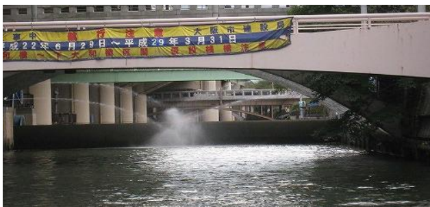
写真7 水門が開く状況 3)

参加者の感想には、「大正から昭和初期にかけて、大川(旧淀川)には当時の橋梁技術の粋を集めて多くの橋が架けられた。それらが戦争など困難な時代を耐え、先人たちの弛まぬ努力により保全されて、近年造られた高層ビルと相まって中之島の素晴らしい都市景観を形づくっていることに感銘を受けた。今、大阪は、外国からの多くの観光客が訪れ大いに賑わっている。それに伴い、橋や護岸には美しい装飾や舞台・テラス施設が施されているが、これらの装飾・施設が橋や護岸の保全に支障を起こさないかと懸念している」とあった。