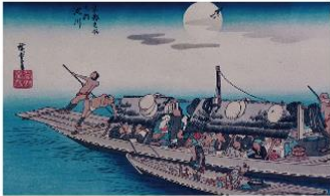
三十石船に漕ぎ寄せる、くらわんか船(安藤広重画)