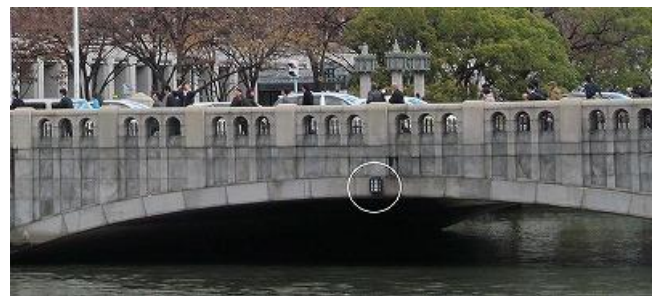
写真8 桁下空間はせまい(淀屋橋) 3)

11月、12月、1月は、10月に舟で巡った橋を訪ねて歩いて廻った。市の中心部の橋巡りで学んだのは、大阪の町の歴史である。江戸時代には大坂は天下の台所として栄えたが、縦横に流れる川が物流ネットワークとして機能し、全国から集まった物産は舟運を利用して京の都へ運ばれ、逆に都の文物は大坂へ運ばれて大坂が日本経済の中心となった。そして莫大な富を得た町人たちの手で多くの橋が架けられたことを改めて知った(写真9、10)。昭和以降、多くの堀川が埋め立てられ、物流ネットワークとしての河川の役割は減少したが、浪速八百八橋の名にふさわしい景観は残されている。