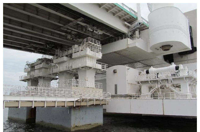
写真6 旋回装置（夢舞大橋） 3)