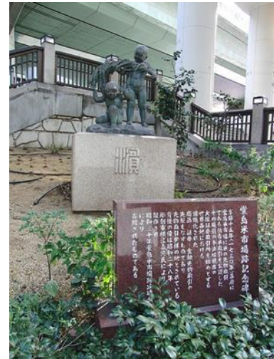
写真 10 堂島米市場の碑 3)