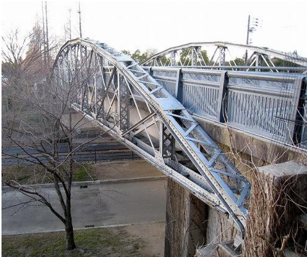
写真 11 緑地西橋 3)