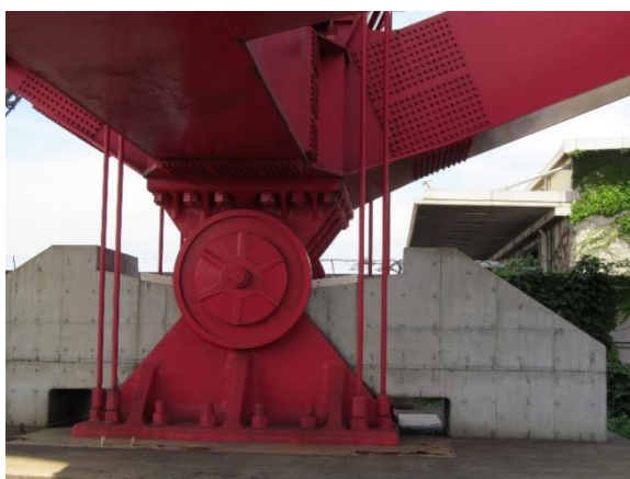
写真5 沓の耐震補強（港大橋） 3)

7月には、湾岸部の長大橋を巡った。港大橋では、阪神高速(株)のご好意により、中間支点の管理用エレベータを利用して上弦材まで登り、トラス構造を間近に見ながら説明を受けた。巨大地震に備えた様々な耐震補強対策は興味深いものであった（写真5）。天候に恵まれ、橋上からは360° 展望でき、周辺の橋梁群とともに、はるか遠く明石海峡大橋まで眺めることができた。その中でも此花大橋は、モノケーブル吊橋というユニークな型式の橋であり、架設地点が軟弱地盤であるため自重の大きいアンカレッジを省いて自碇式としたとのことだった。なお、名橋50選には含まれないが、近距離にあった夢舞大橋も見学した。大型船舶の航行を確保するため開発された二つの鋼製ポンツーンによる浮力で支えられたダブルアーチ形式の世界初の浮体式旋回可動橋である。護岸の近くに設置されている係留装置や可動装置は、通常の橋梁には見られない特殊な構造である（写真6）。浮体橋の波浪動揺・潮位変動に追随する両側の緩衝桁との間の伸縮装置等は、車で浮体橋を往復して調査した。