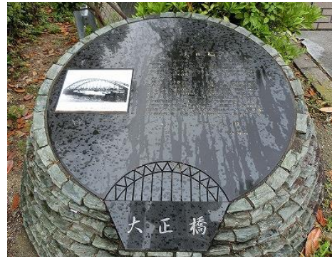
写真4 大正橋の歴史碑 3)

7月には、湾岸部の長大橋を巡った。港大橋では、阪神高速(株)のご好意により、中間支点の管理用エレベータを利用して上弦材まで登り、トラス構造を間近に見ながら説明を受けた。巨大地震に備えた様々な耐震補強対策は興味深いものであった（写真5）。天候に恵まれ、橋上からは360° 展望でき、周辺の橋梁群とともに、はるか遠く明石海峡大橋まで眺めることができた。その中でも此花大橋は、モノケーブル吊橋というユニークな型式の橋であり、架設地点が軟弱地盤であるため自重の大きいアンカレッジを省いて自碇式としたとのことだった。なお、名橋50選には含まれないが、近距離にあった夢舞大橋も見学した。大型船舶の航行を確保するため開発された二つの鋼製ポンツーンによる浮力で支えられたダブルアーチ形式の世界初の浮体式旋回可動橋である。護岸の近くに設置されている係留装置や可動装置は、通常の橋梁には見られない特殊な構造である（写真6）。浮体橋の波浪動揺・潮位変動に追随する両側の緩衝桁との間の伸縮装置等は、車で浮体橋を往復して調査した。