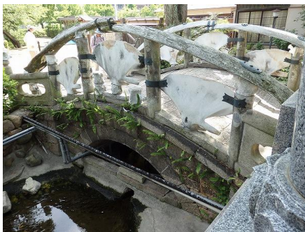
写真 1 雪鯨橋の高欄 3)

第 1 回目の 5 月は淀川の下流から上流に向かって新淀川大橋から豊里大橋、さらに足を伸ばして雪鯨橋まで 11km ほどを歩いた。当日は快晴に恵まれたが、炎天下の長距離歩行は厳しく、できるだけ日陰を歩いてこまめな水分補給をする必要性を実感した。雪鯨橋は瑞光寺の境内にある高欄が鯨の骨で作られた珍しい橋で、その詳しい由来は文献 3)に掲載されている(写真 1、2)。また、淀川を跨ぐ橋は橋梁形式が多彩で学生向けの教材としてふさわしく、このコースは後述のように学生を引率して巡ることになる。