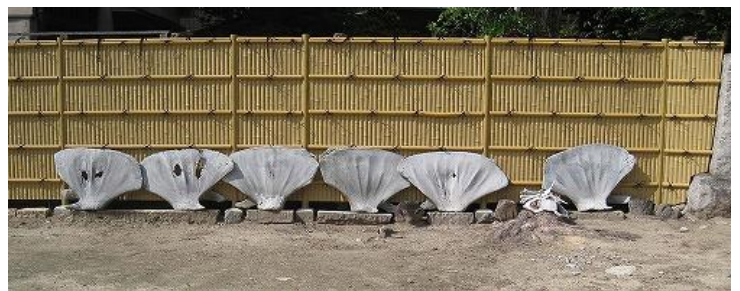
写真 2 五代目の高欄の鯨骨 3)

6 月には、大阪市周辺部の橋を巡った。平野川沿いでは住民生活の身近にある橋を巡り、「つるのはし跡」を訪ね、地域の歴史・文化と橋との密接な関わりを知り、橋がまちづくりの中でいかに重要な地位を占めているかということを実感した。写真 3 および 4 に例示するように、いくつかの橋には、由来を記した銘板が設けられており、橋の歴史や地域との関係を知る助けとなっている。