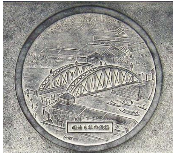
写真 12 明治6年の心齋橋 3)

名橋巡りを終えて、撮影した写真や資料の整理、追加情報の内容と掲載方法の検討、個々の橋の解説記事の作成などの作業を分担して行い、2017年4月には「浪速の名橋50選」の改訂版が完成した。この改訂版の写真は、HP担当の森俊彦氏、田中洋氏の撮影した写真が多く、橋がいろいろな視点で撮影され、橋の周辺環境や歴史・文化がわかる写真も豊富で内容が充実している。これをCVVのHPの中だけに収めるのは、もったいないと感じている。