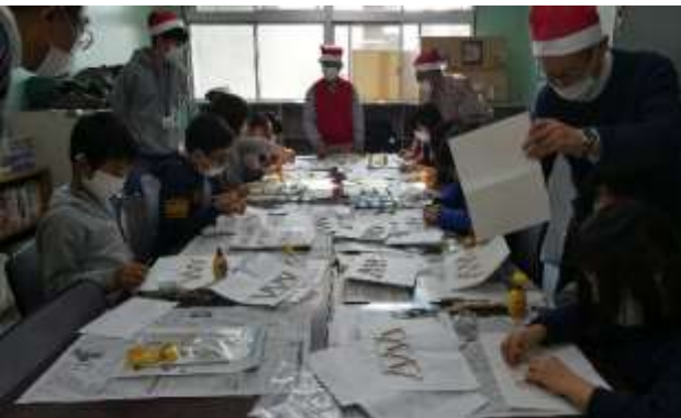
トラス橋の模型づくりに取り組む子供達