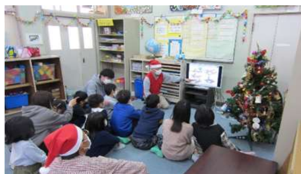
大昔や昔、今日の橋の話に聞き入る子供達