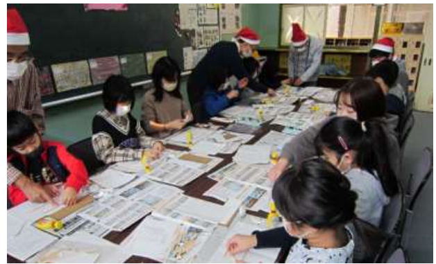
トラス橋の模型づくりに取り組む子供達