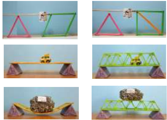
三角形と四角形 けた橋とトラス橋 模型実験