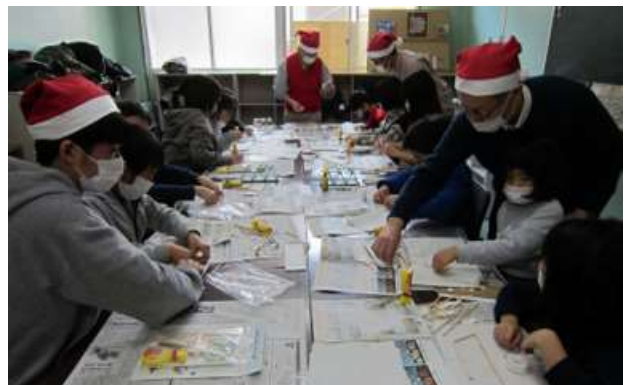
手解きを受けながら模型づくりに取り組む子供達