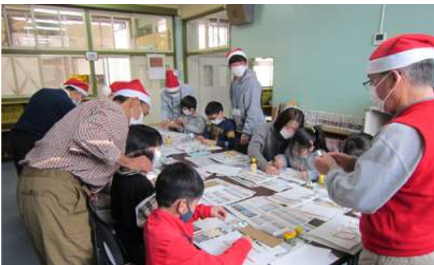
手解きを受けながら模型づくりに取り組む子供達