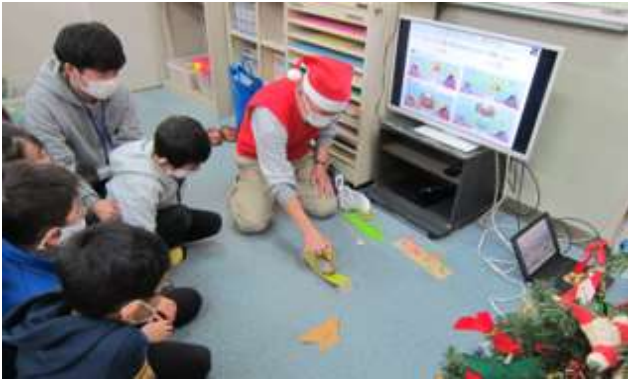
けた橋とトラス橋の載荷実験に注視する子供達