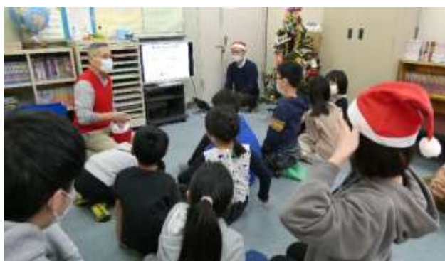
CVVメンバーによる橋の話に聞き入る子供達