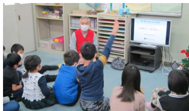
CVVメンバーの質問に元気に答える子供達