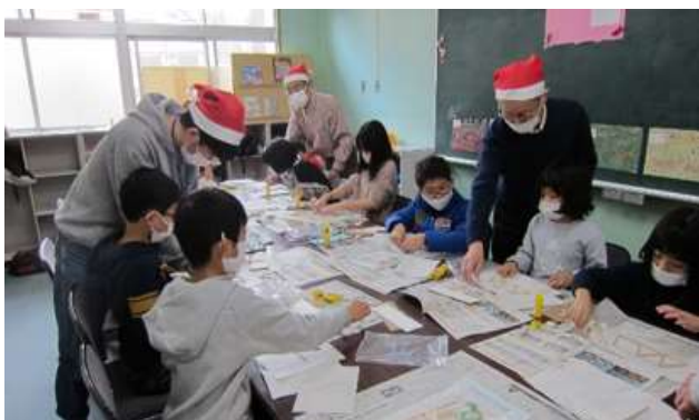
手解きを受けながら模型づくりに取り組む子供達