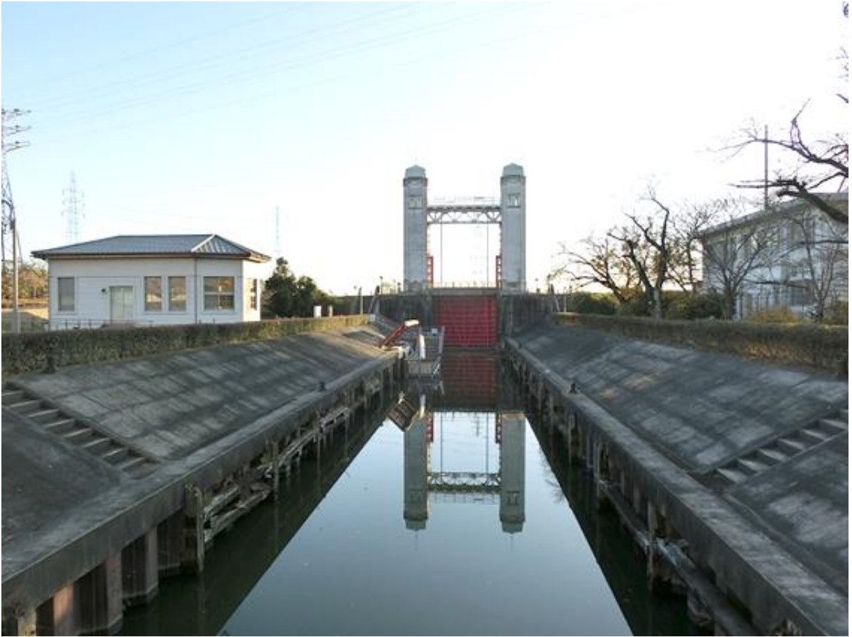
運河と資料館（左側建物）