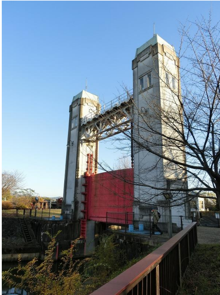
昭和初期の立派なゲート