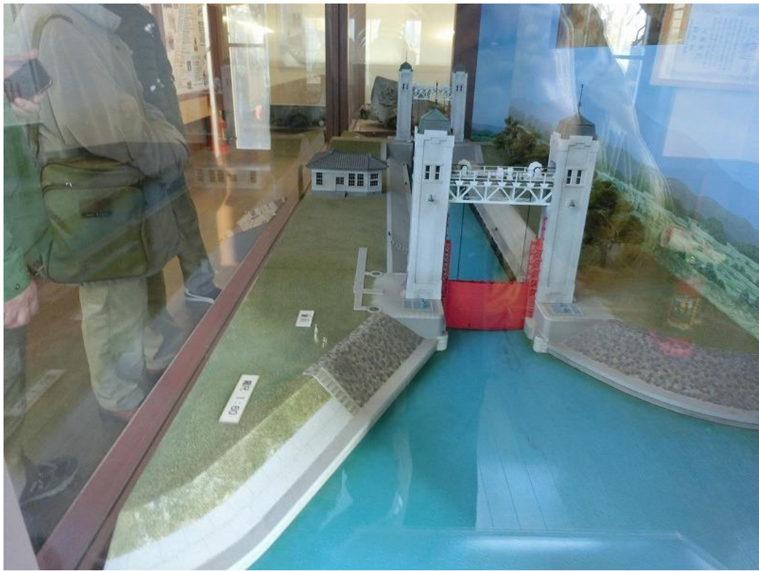
三栖閘門の正確な模型（動力ゲートは動きます）