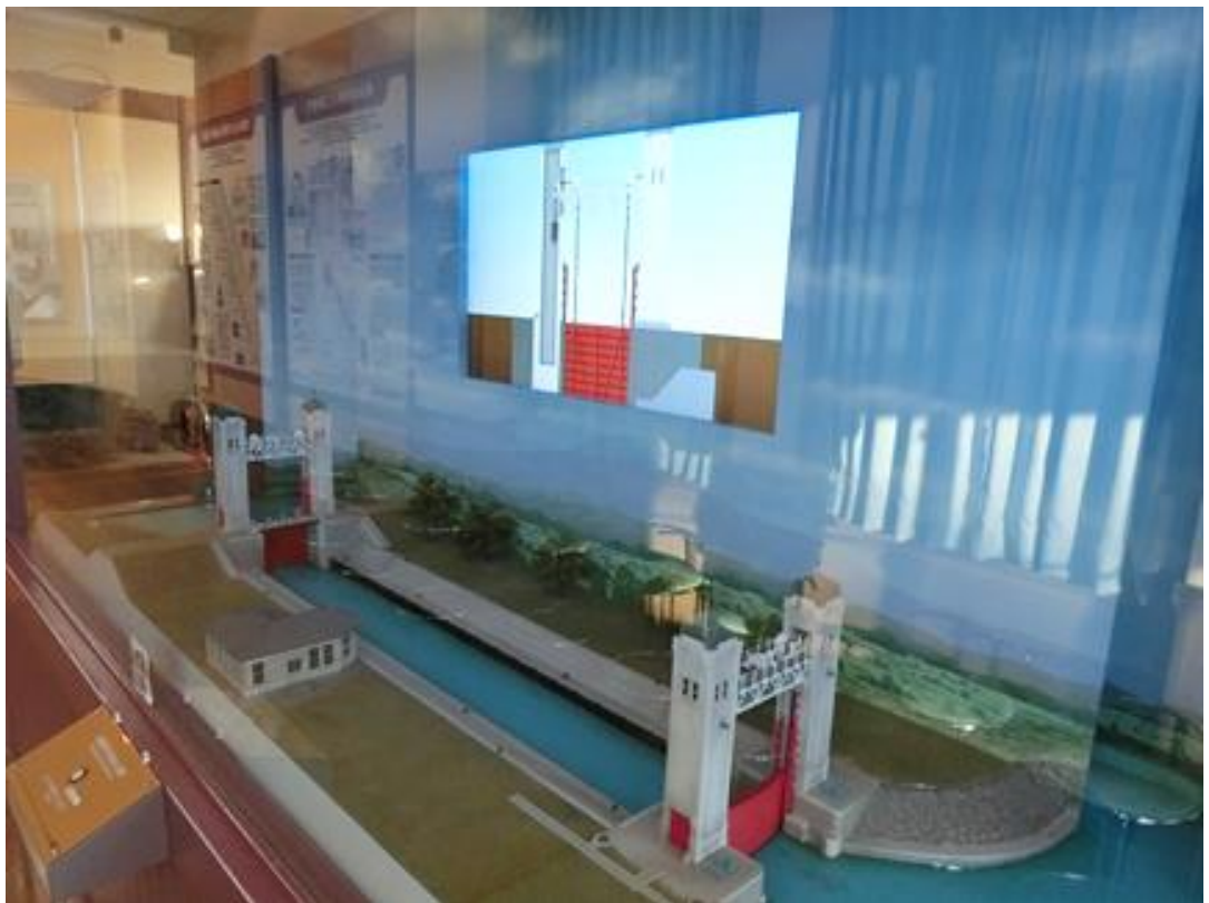
水の高さも変化します。楽しい模型です