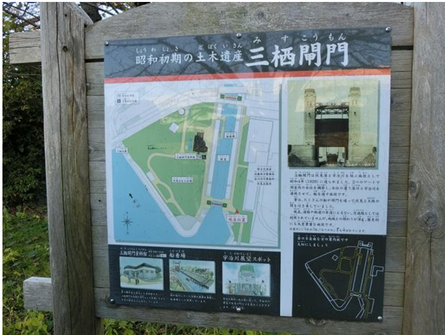
(上の画像をクリックすると拡大して見られます)