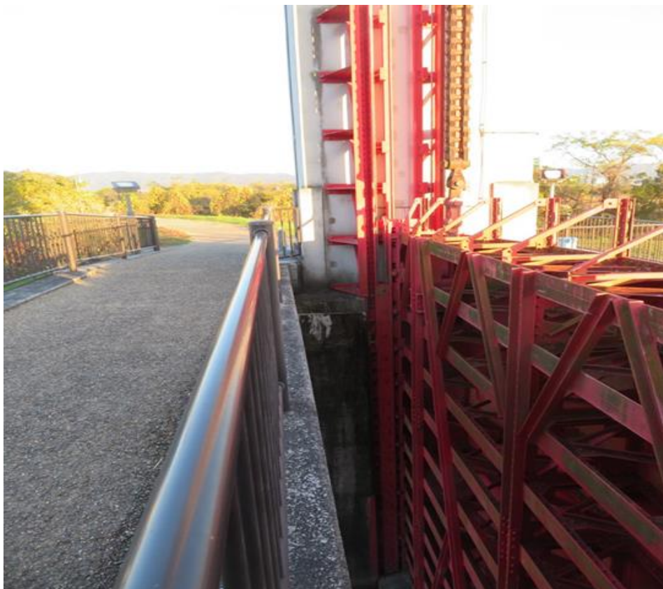
後扉（今もなお淀川堤防の機能を担っている！）