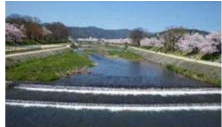
写真4 北山大橋上流の落差工 2)

賀茂川・鴨川と高野川には「飛び石」があり、この「飛び石」は河床の安定を図ることを主目的にしているため、河川構造物の分類では床止工の「帯工」に分類される。川底にはいろいろな形のコンクリートブロックが配置されており、平常時には人が渡ることができる二次的な役割も果たしている。この「飛び石」は今から30年前に河川環境整備の一環として親水機能を併せ持つものとして京都府河川課によって設置された。