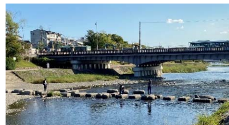
写真5 賀茂大橋上流の飛び石