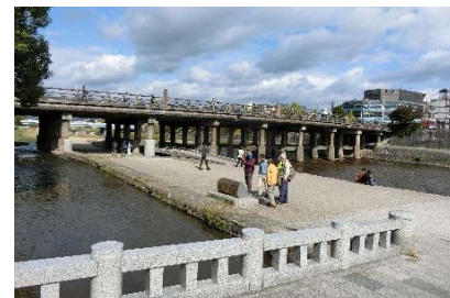
写真6 みそそぎ川の河川構造物