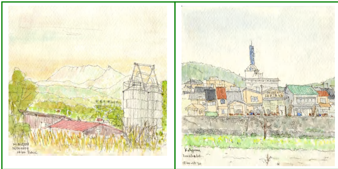
(蒜山・サイロと大山)

このように、今では、スケッチは、ぼくの生活の一本の柱になっています。そして、最近、どんな考え方、気持ちで絵を描いてきたのかなと振り返って見る気分になりました。